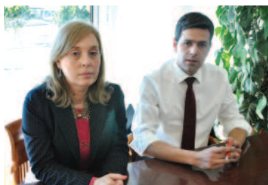
Conselho de Administração da GEBALIS

Quantas vezes nos esquecemos ou sentimos acanhamento de agradecer algo que nos é feito ou dito?