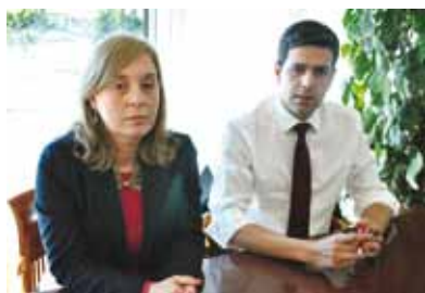
Conselho de Administração da GEBALIS

A GEBALIS assinou no passado mês de Março a renovação do Acordo de Adesão ao Fórum para a Igualdade de Género.